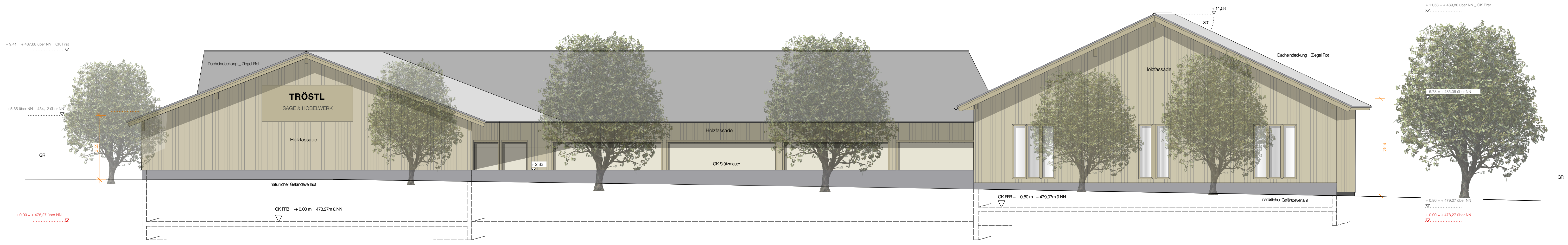
Ansicht Ost _ 1:100 ± 0,00 = + 478,27 über DHHN 2016