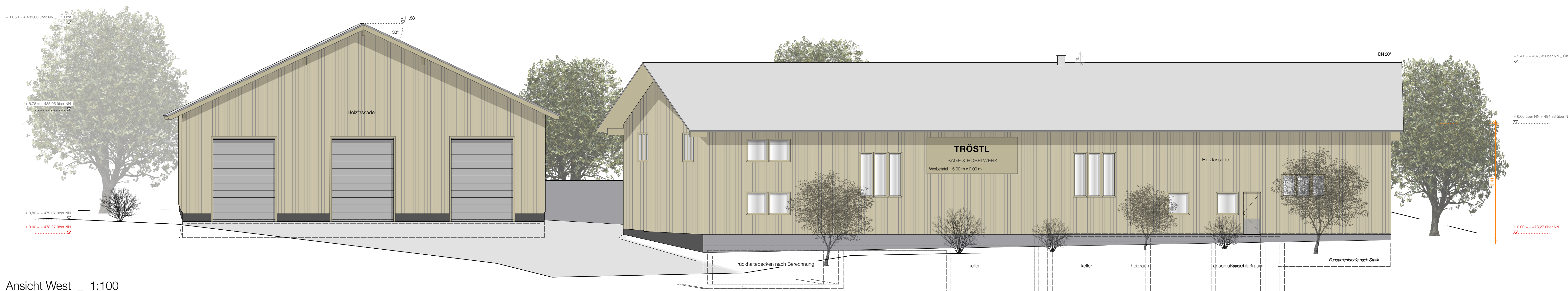
Ansicht West _ 1:100 ± 0,00 = + 478,27 über DHHN 2016

NEUBAU EINER PRODUKTIONS- UND LAGERHALLE GRUNDSTÜCK Gemarkung Obertaufkirchen | Landkreis Mühldorf a. Inn | Bezirk Oberbayern Straße Dieselstraße | 84419 Obertaufkirchen Fl.Nr. 924/1 | Fläche 6510 m²