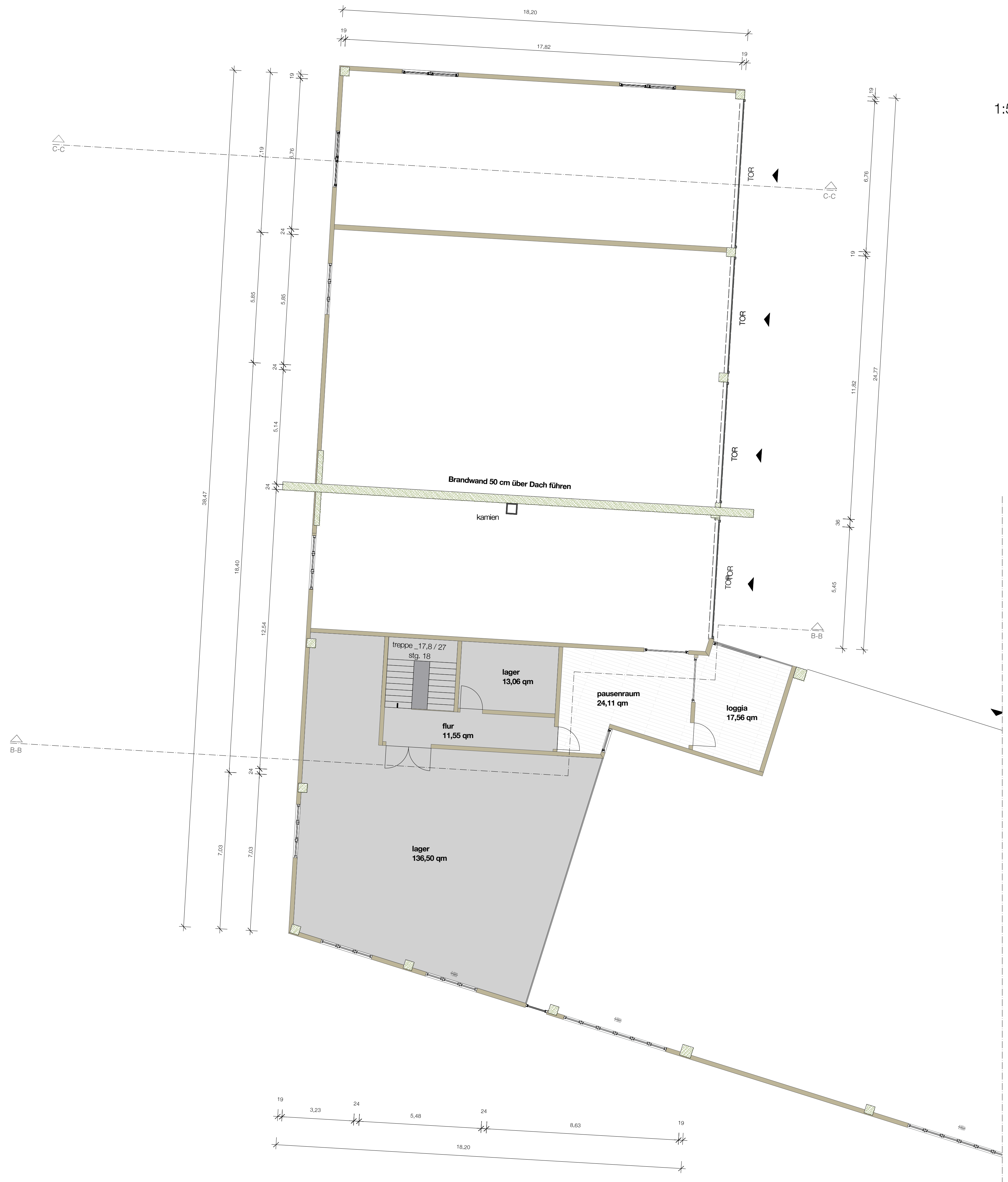
E1_ 1:100 x 0,00 = + 478,27 über DHHN 2016