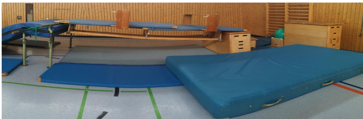
Text und Bild: TSV Obertaufkirchen e.V.

Anmeldung und weitere Informationen: Veronika Brenner mobil: 0151 / 56106929