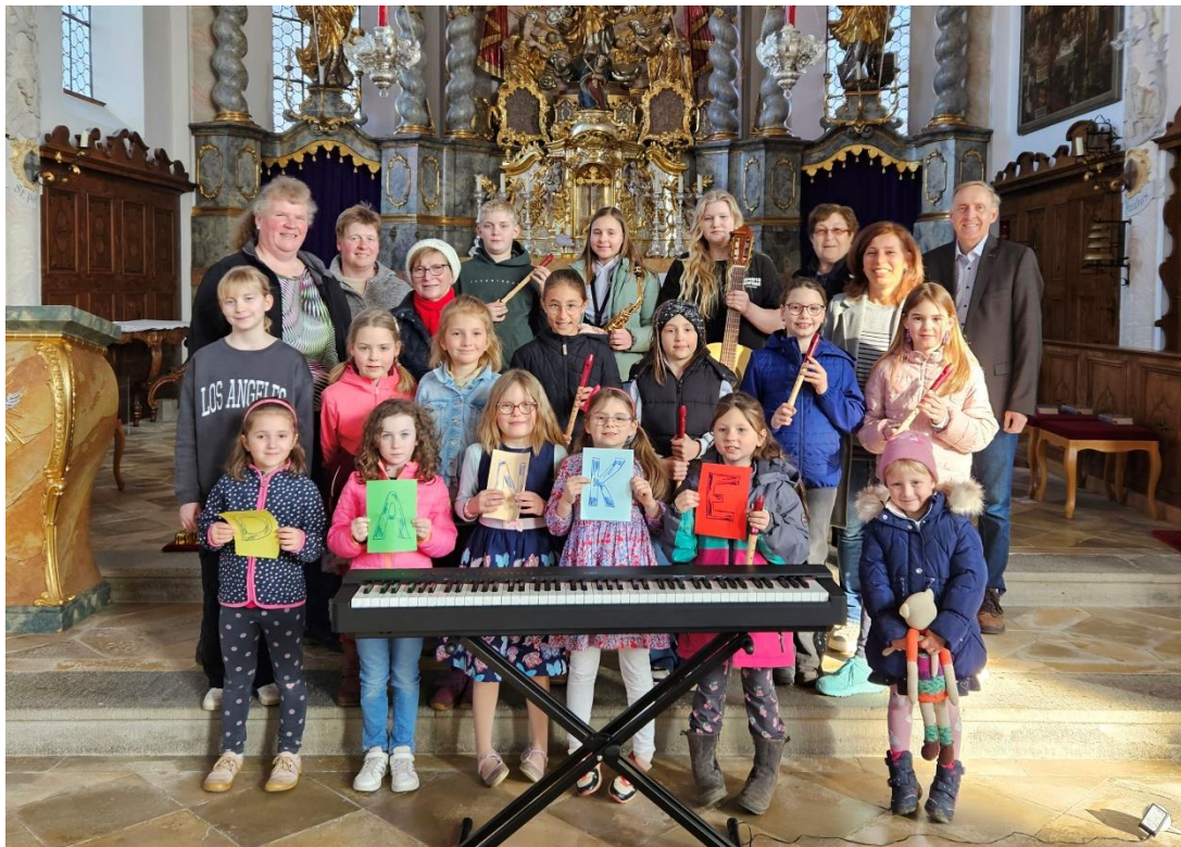
Text und Foto: Elisabeth Auer

Sing- und musizierfreudige Kinder und Jugendliche sind herzlich eingeladen, beim Kinder- und Jugendchor mitzumachen. Bei Interesse gerne melden bei Elisabeth Auer (Tel. 08082 / 275).